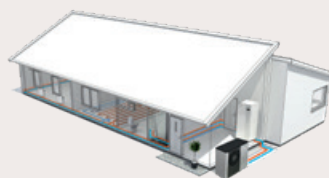
Topline F2120 mit Innenmodul Energiezentrale VVM